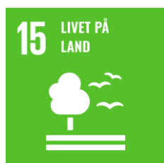
SDG 15. Livet på land