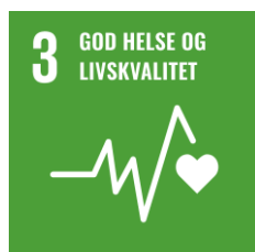
SDG 3. God helse og livskvalitet