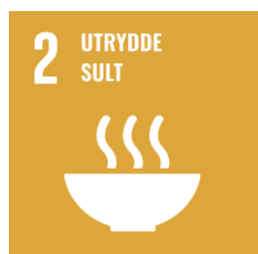
SDG 2. Utrydde sult

FNs bærekraftsmål er verdens felles arbeidsplan for å utrydde fattigdom, bekjempe ulikhet og stoppe klimaendringene. FNs medlemsland har vedtatt felles mål for en bærekraftig utvikling frem mot 2030. FNs bærekraftsmål består av 17 mål og 169 delmål. Med bakgrunn i vesentlighetsanalysen er det identifisert seks hovedmål som er særlig relevante for Graminor, enten ved at selskapet har, eller potensielt kan ha, særlig påvirkning på målet i positiv eller negativ forstand.