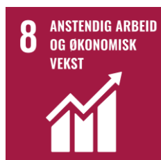
SDG 8. Anstendig arbeid og økonomisk vekst