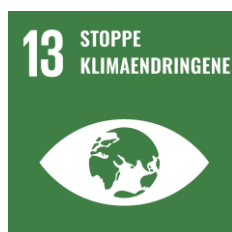
SDG 13. Stoppe klimaendringene