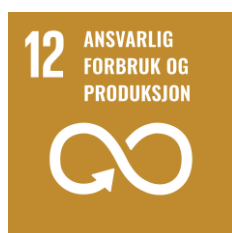
SDG 12. Ansvarlig forbruk og produksjon